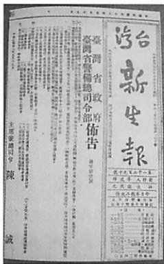
図1 戒嚴令の布告 (『台湾新生報』1949年3月19日)