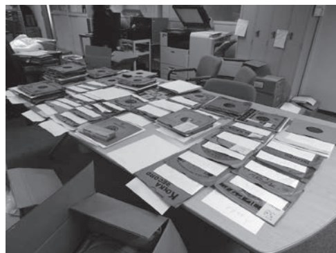
写真2 SPレコード整理・分類作業2