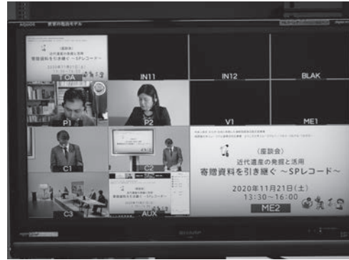
写真6 ZOOMによる座談会2