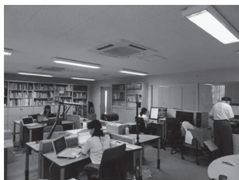
写真4 基礎データ入力作業