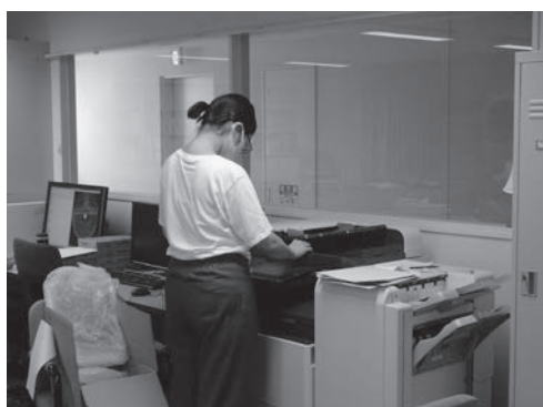
写真3 レーベルのスキャナ作業