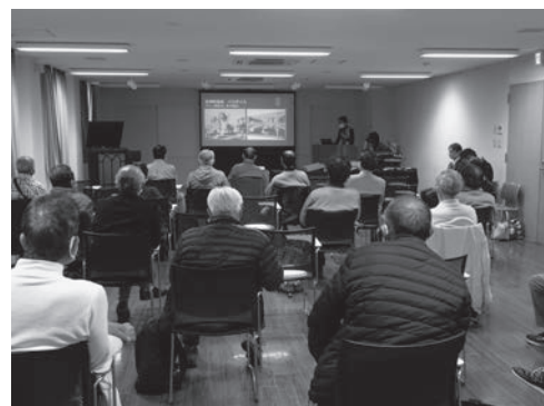
写真8 研究成果報告会2