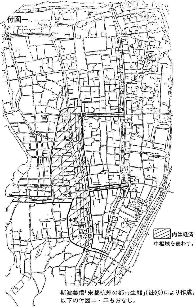
斯波義信「宋都杭州の都市生態」(註⑳)により作成。 以下の付図二・三もおなじ。