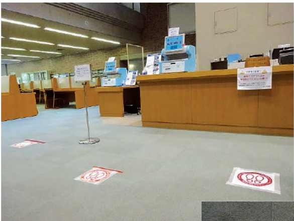
タイルカーペットに貼付した ソーシャルディスタンスシール