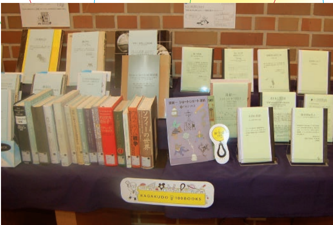
春学期展示「科学道100冊」