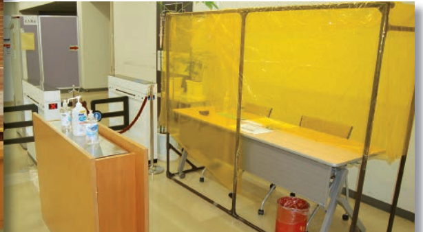
利用者と対面するカウンターにはスクリーンを設置