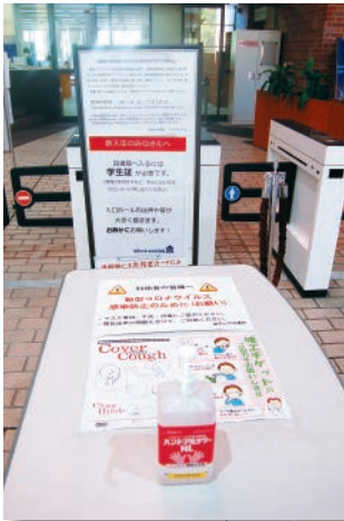
エントランスには消毒薬を設置 マスク着用や咳エチケットの注意喚起も