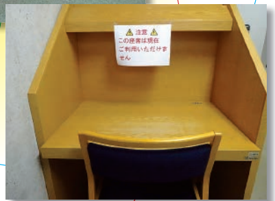
密を避けるため閲覧用椅子を間引き、移動を禁止した