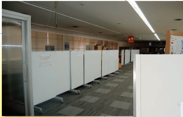
全面利用停止となった ラーニング・commons