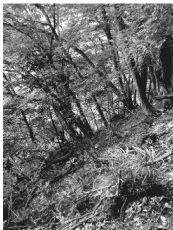
写真 7

そこから 12~3 分林道を走った後、ガードレールの切れ間で F を乗せた車が止まったので参加者全員が一旦は降りたが、F が、「かなり危険なところにあると分かったので、体力的に自信がある人だけついてきて下さい」と言ったので、6 人だけが F についていくことになった。道とは思えない廃道(写真 7)を進んでいったところ、放置された神社と磐座があった(写真 8)。当日は猛暑日だったが F が持参した温度計で測ったところその場の温度は 15 度であった。