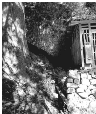
写真 8

Y のサロンに戻ってきてからは、ディスカッションが行われた。最初は Y が講演会をするようなイメージをもっていたが、実際は会員がそれぞれに意見を出し合い、初参加者からの質問に対しても、Y は、「その話なら G さんの方が詳しいから」、「それは F さんに教えてもらった方が良い」と言い、Y 以外が答える場面も多くあった。