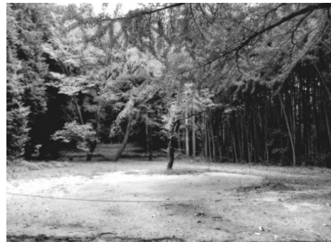
写真 2