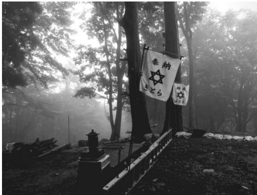
写真 5

大杉神社を守る会では、神社への奉仕活動に定期的に参加し、自主的に大杉神社のために奉仕をしようとする人を会員として認めている。