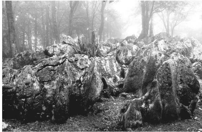
写真 4 筆者が撮影