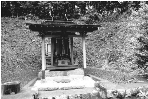
写真 1

X によれば、この神社の参拝の仕方は他の神社の二礼二拍手一礼とは違い、三礼三拍手一礼が正しく、そうでなければ参拝したことにならず、また、参拝の後の 1 ヶ月以内に願い事がかなえられたか否かにかかわらず、お礼の参拝に来なければ 2 度と耳を傾けて貰えなくなるということだった。