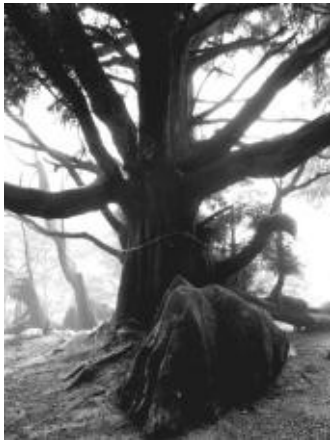
写真 3

Y によると、参拝対象は神社の御神木そのものであり(写真 3)、降り注ぐエネルギーは、多くの神々や精霊を癒すとされ、他の神社の神々がやってきては、ここで休んでいるという。また、神社の奥の磐座群(写真 4)は UFO の着陸地点とされ、見えない結界のため、その場に選ばれた者しか入れないということであった。