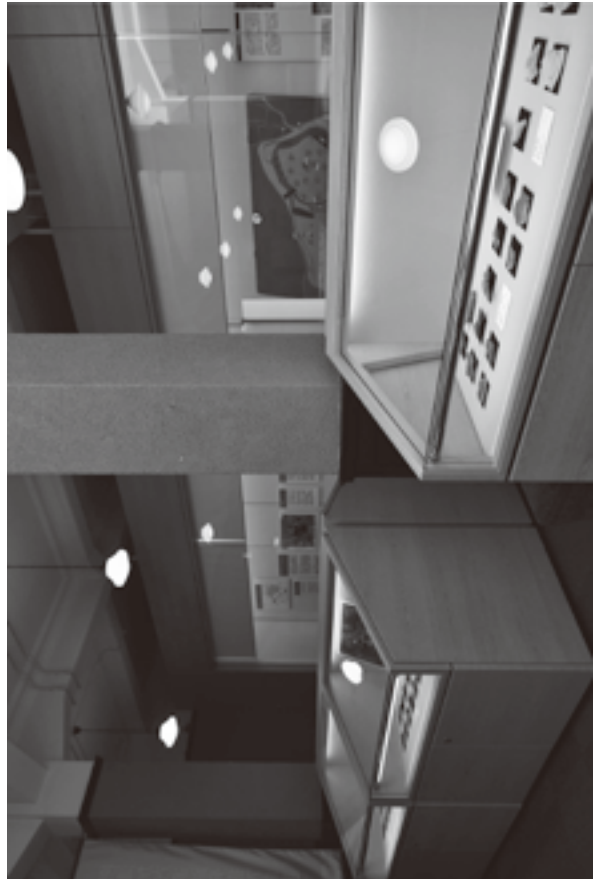
(資料8) 展示状況写真 7