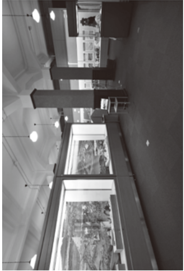
(資料8) 展示状況写真 12