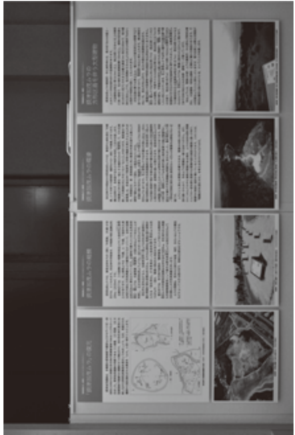
(資料8) 展示状況写真 11