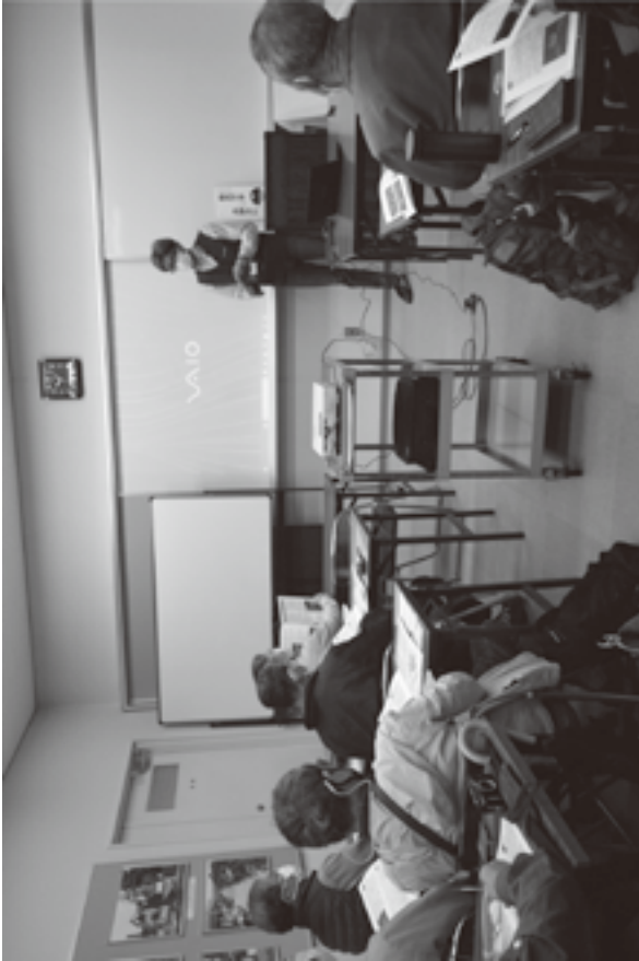
(資料9) 摂津加茂遺跡ウォーク事業実施状況写真