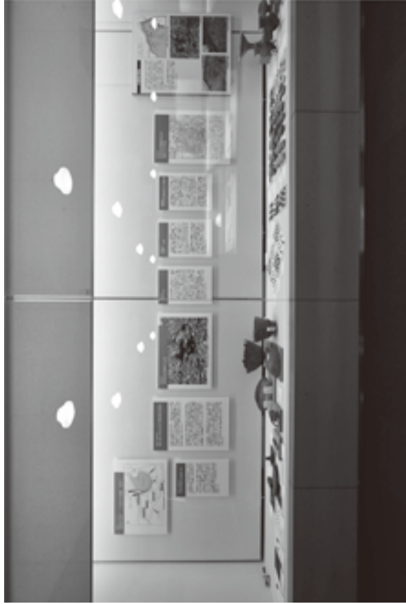
(資料8) 展示状況写真 10