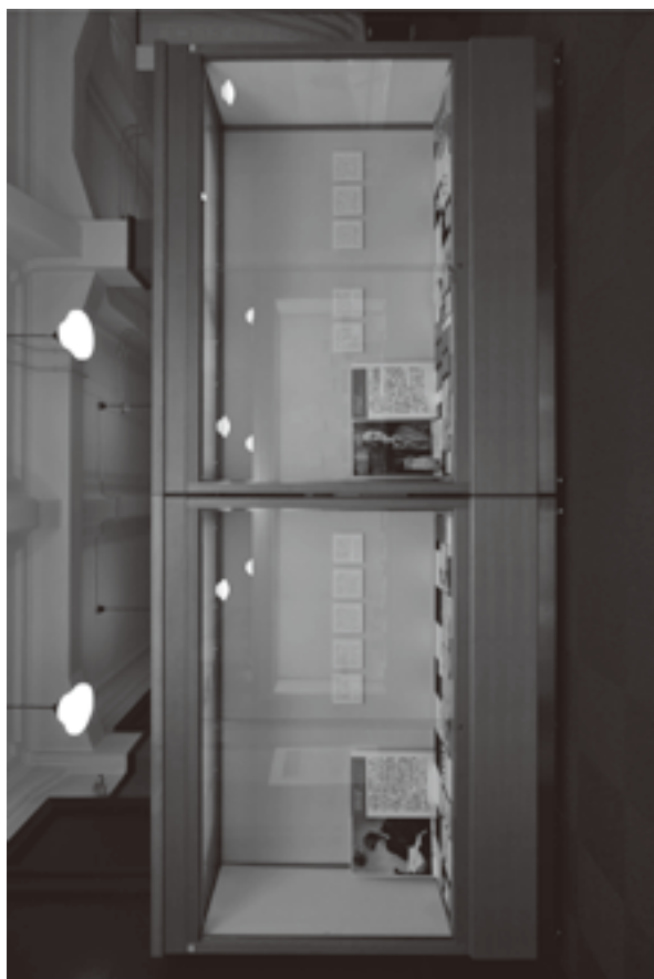
(資料 8) 展示状況写真 6