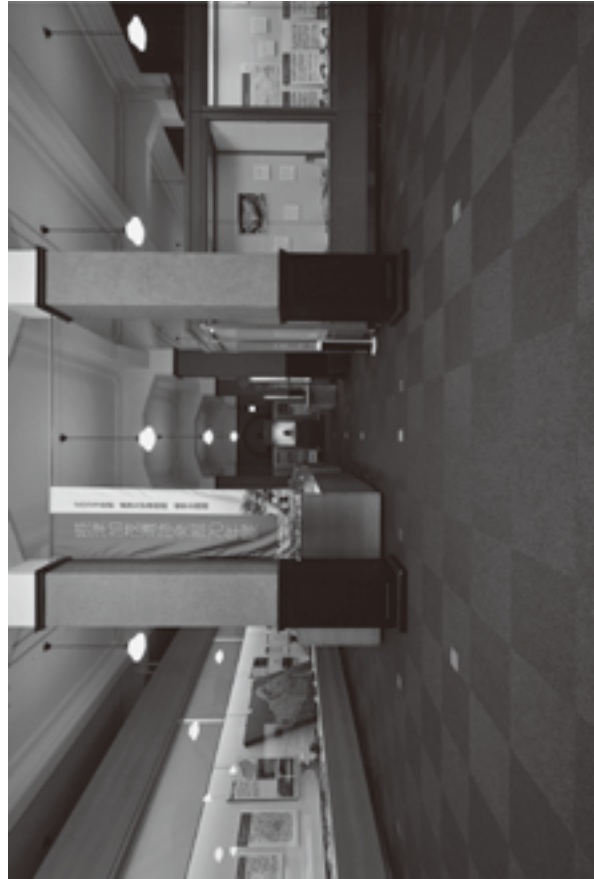
(資料8) 展示状況写真 1