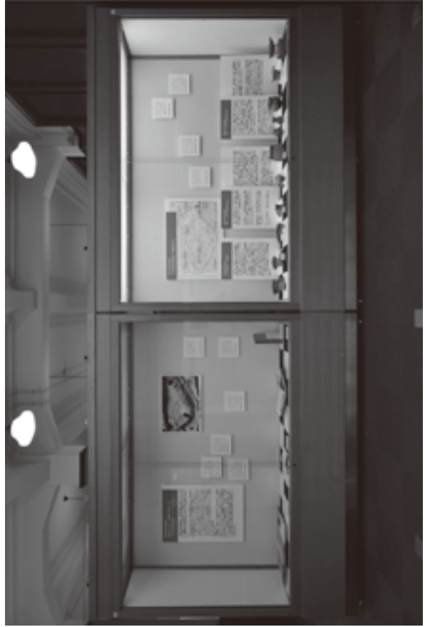
(資料8) 展示状況写真 4