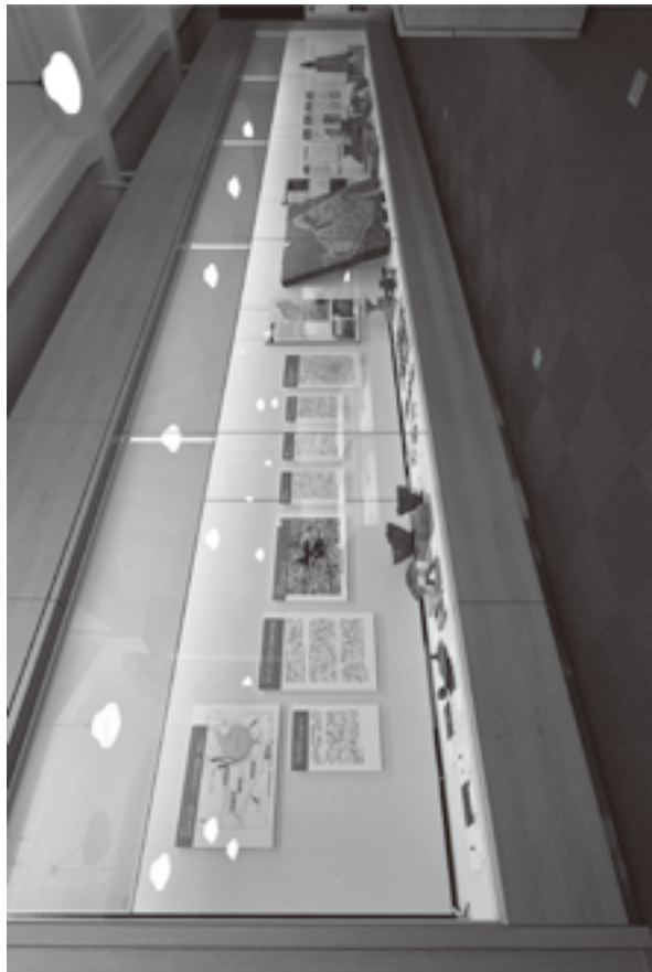
(資料8) 展示状況写真 9