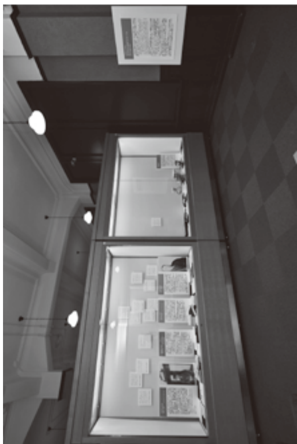
(資料 8) 展示状況写真 5