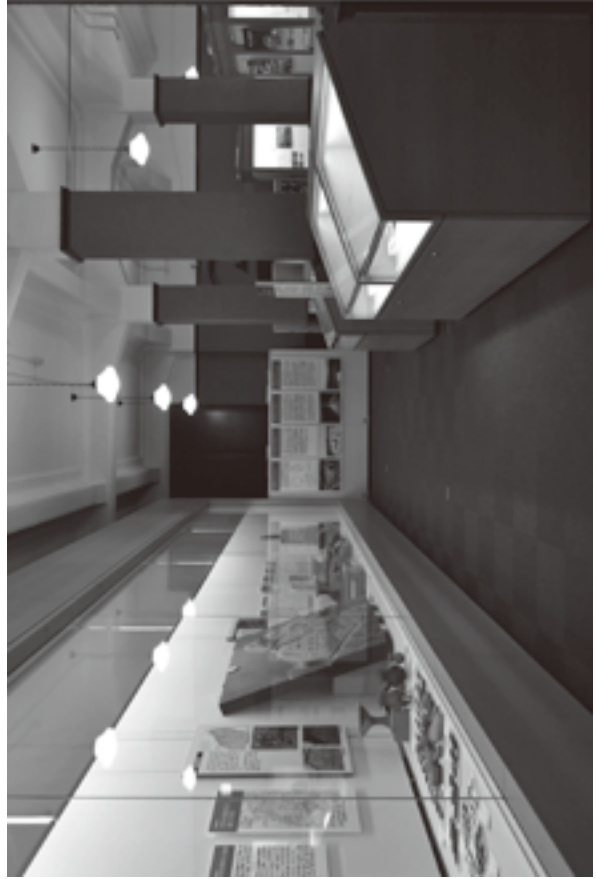
(資料8) 展示状況写真 8