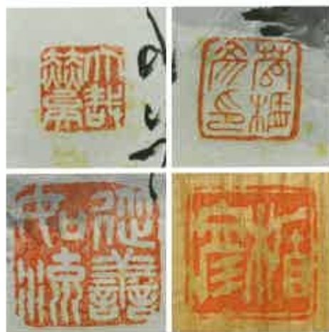
写真2 「金剛暮雲」の姓名印と関防印（原寸）

なお、楯彦の作品には、「萬歳」「中元踏歌」をはじめ、同名同工の作品が散見されることか