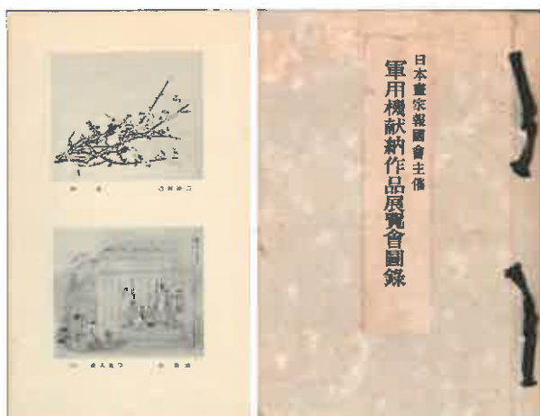
写真6 軍用機献納作品展覧会図録

逼迫した戦局下、画用絹購入に切符制が適用される事態に端を発して1942年3月、日本画製