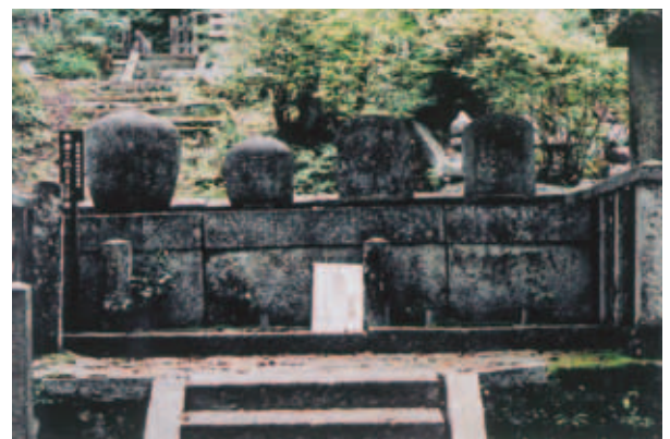
写真2 角倉了以夫妻の墓（左）、素庵夫妻の墓（右） 〈嵯峨〉二尊院