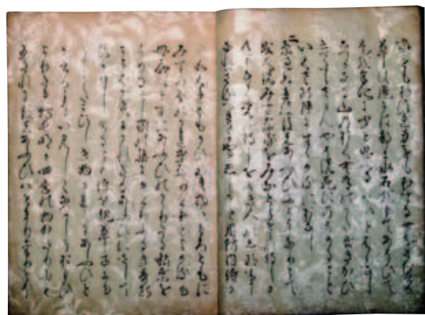
写真5 嵯峨本『徒然草』 個人蔵

慶長の前半、嵯峨の印刷・製本工房では、古活字版による漢籍や大部な中国史書『史記』(袋綴装、大本、有界八行本、百三十巻・五十冊、国立公文書館内閣文庫本ほか多数現存)などが刊行された。それと並行して、漢字に平仮名を交えて印刷する国書の《嵯峨本》の出版が準備されていた。そして慶長八年(1603)以前に、美しい装訂になる最初の《嵯峨本》、古活字版『徒然草』(袋綴装、上下二巻・二冊、雁皮の本文料紙には紫苑模様などの雲母刷文様が施されている。写真5)が刊行された(小秋元段「嵯峨本『史記』の書誌的考察」『太平記と古活字版の時代』所収、2006年、新典社)。