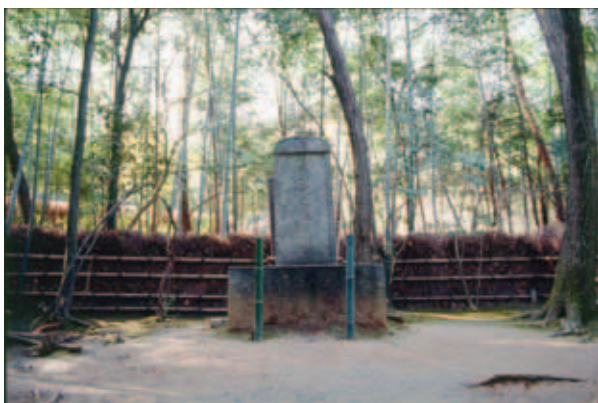
写真1 角倉素庵の墓 〈嵯峨〉化野平山 銘「貞子元之墓 子元吉田素庵ノ之字也諱順」

嵯峨角倉末裔の吉田周平氏（奈良県三郷町）によれば、素庵の長子玄紀から八代後の與一玄匡の奥方が文政三年（1820）八月十九日に死去した後に作成された京角倉墓の絵図面には了以夫妻、素庵夫妻の四基の墓が記されており、現行通りである。しかし文化十年（1813）に「了以翁二百回忌」があったが、「素庵貞子元」の墓が新たに造られたという記述は今のところ見当たらない。文化四年（1807）六月、二尊院廟所について記した西（嵯峨）角倉の調書があるが、それにも素庵の墓についての記載がない。文化四年の時点では、「素庵貞子元」の墓は二