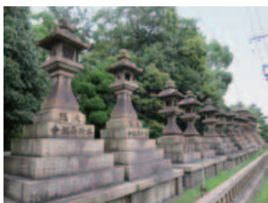
写真1 境内正面側の石燈籠

住吉神は海の神としての信仰があつく、古代の遣唐使派遣の際にもその安全を祈った。次第に和歌の神、文学の神としての信仰も集めたが、江戸時代になって海上交通路が