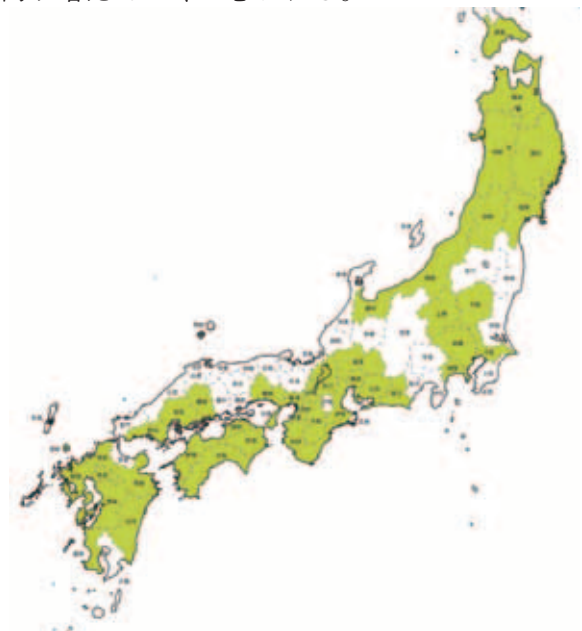
図1 銘文の地名からみた奉納者の居住地

また、住吉大社の石燈籠と対応する形で、取引先商人たちが居住地の氏神社にも石燈籠を造った事例を、徳島市の金刀比羅神社や富山県高岡市の関野神社で確認しており、今後さらに類例が増えていくと思われる。