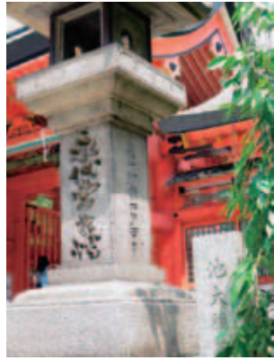
写真2 畷物商寄進の石燈籠 写真3 吉文字屋寄進の石燈籠