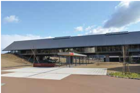
写真2 福井県年縞博物館の外観

2018年9月には三方湖に面した縄文ロマンパーク内に「福井県年縞博物館」(写真2)がオープンした。館内の常設展示では、この45mにわたる7万年分の実物の年縞をステンドグラスにして展示している(写真3)。来館者は45mのステンドグラスとなった年縞を観察しつつ歩みを進めることで、7万年の時をさかのぼること