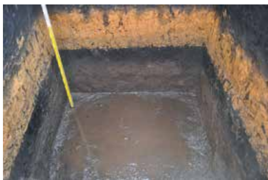
写真1 アカホヤ火山灰(写真上部のオレンジ色の層)の堆積状況

考古学研究において、火山噴火によって堆積した火山灰をはじめとする堆積物は、遺跡や遺構の年代を推定する上で極めて重要な位置を占める。アカホヤ火山灰が安定して堆積している南九州の遺跡において、この火山灰層は縄文時代の「鍵層」として遺跡の年代を理解する上で、さらには地域を異にする遺跡間の共時性を導き出す際に重要な役割を果たしている。アカホヤ火山灰については、これまでも ^{14}\text{C} 年代測定法を用いた研究を中心に、降灰年代の推定がなされてきた。より誤差の少ない正確な年代を推定することは、単に個別の遺跡・遺物に年代的位置づけを与えるだけでなく、空間的に隔てた地域の遺跡を比較検討する際に、大きな手掛かり