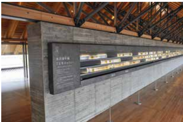
写真3 常設展示の年縞ステンドグラス