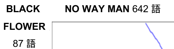
図 2: 局所スコア – 大域スコア最大の組合せ楽曲のアライメント足跡

は延べ 1,738,455 単語に 200 次元の分散表現を付与している。形態素解析には MeCab [7] を用いた。形態素解析に用いる辞書は、Unidic-mecab の version 2.1.2 を用いた。最新の辞書ではなく古い Version 2.1.2 を用いた理由は、国立国語研究所が配布する分散表現を計算する際に用いた辞書と同じ条件で形態素解析を行うためである。単語間の距離はコサイン類似度を用いた。