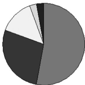
光緒10年仁川口入港中国帆船隻数