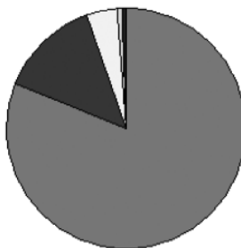
光緒10年仁川口入港中国帆船総担数