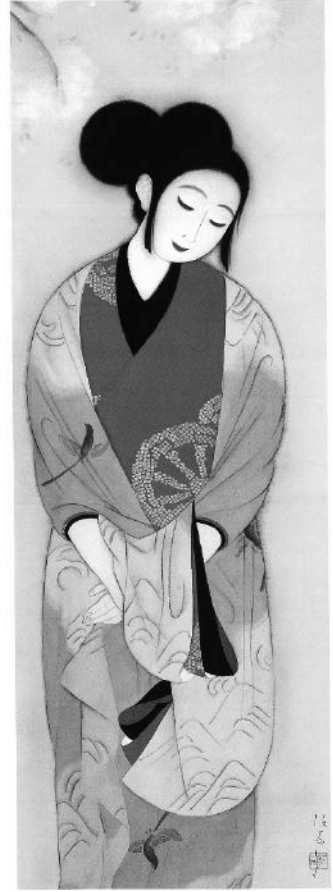
〔図四〕北野恒富《花》(部分)