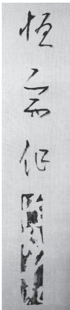
〔图二〕《花の夜》落款印章