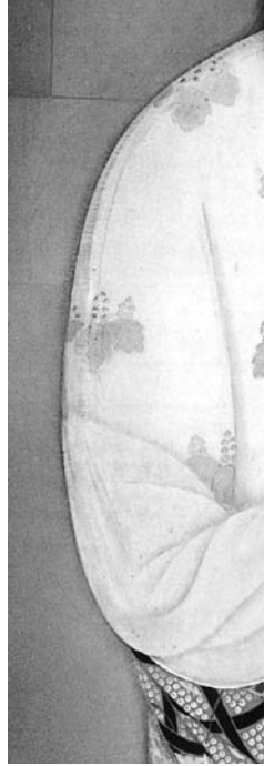
〔図五〕《淀君》(部分) (耕三寺博物館蔵)