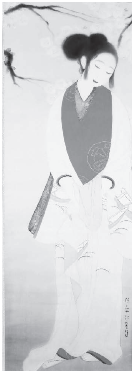
〔图一〕北野恒富《花の夜》