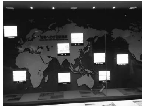
図5. 神戸港の世界航路図

紹介しながら、川崎重工の歴史、エンジンの発展、企業製品を展示している。観客は陸海空の各分野で活躍する技術を把握している川崎重工の歴史と未来の展示から、企業に対する印象を深めることができる。 この展示場には、陸海空の各分野をテーマにした模擬装置を用いている。例えば、バイクのシミュレーターは、実車に乗ってサーキット約四分を走行する。また、陸・海・空の各テーマによってクイズとゲーム機が