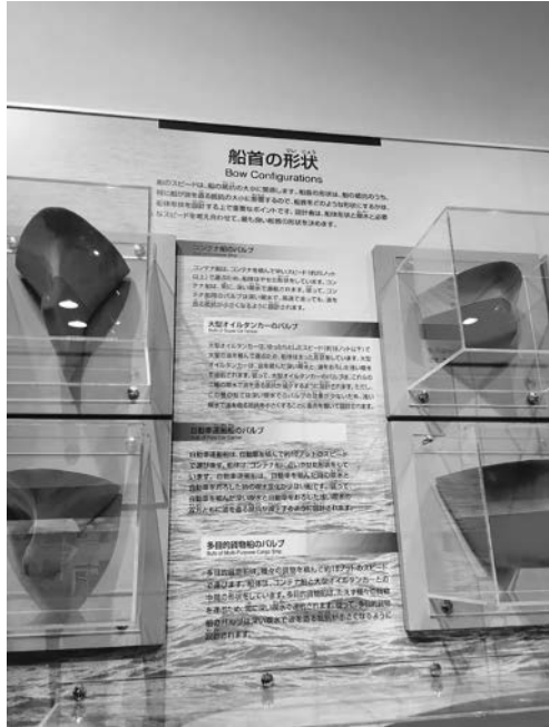
図3. 船首の形状展示