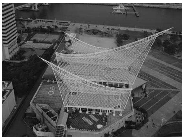
図1. 神戸海洋博物館の外観

外観は、船のような形をした大きな白い屋根を持つ帆船や海の波の特徴とする(図1)。神戸海洋博物館は「海から港から神戸が始まり、未来に船出する。」を当館のコンセプトにし、「神戸開港一二〇年記念事業」の一環として一九八七(昭和六十二年)年に開館された。館の前身は一九六三年に神戸港湾