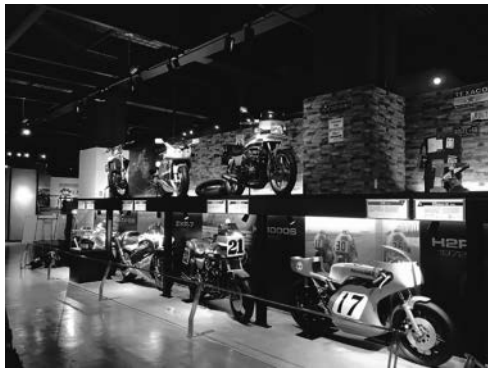
図6. カワサキワールドの工業展