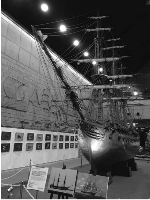
図2. 博物館入り口の玄関ホール

振興協会が運営する中突堤船客待合所ビル内に設置された兵庫県登録の第一号博物館である神戸国際港湾博物館であった ① 。この団体は一般の社団法人で、神戸港の振興策を推進し、神戸港の発展を促進する神戸港湾振興協会が運営する。