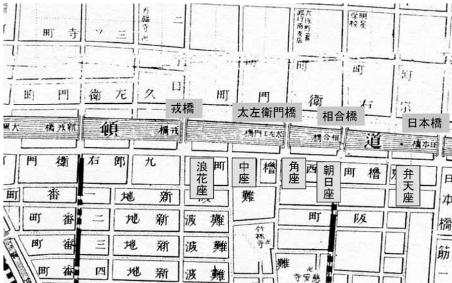
図2 明治時代の道頓堀 (明治38年 [1905]) (地図資料編纂会編『日本近代都市変遷地図集成 [大阪・京都・神戸・奈良]』柏書房、1987年をもとに作成)

ここで、明治時代の道頓堀の劇場を確認しておきたい。当時、道頓堀川の南側には、西から「浪花座」「中座」「角座」「朝日座」「弁天座」の五つの劇場が軒を連ね、道頓堀五座ともよばれた〔図2 明治時代の道頓堀〕。