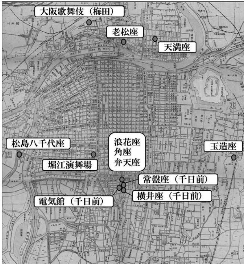
図4 中村儀右衛門が建設に関わった主な劇場（『大阪市新図 縮尺式万分之壹旧新町名掲載 官衙著名諸店舗所在地表』、明治33年〔1900〕をもとに作成）

道頓堀以外にも千日前・梅田・天満・松島・堀江・玉造など、大阪の数多くの劇場の建設に関わった。これらの劇場を地図で確認すると、南は、道頓堀の浪花座・角座・弁天座、千日前の横井座・常盤座・電気館、北は梅田の大阪歌舞伎、天満の老松座・天満座、西は松島八千代座・堀江演舞場、東は玉造座などである〔図4 中村儀右衛門が建設に関わった主な劇場〕。