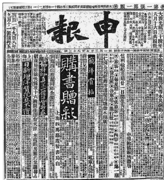
『申報』第12792号、1908年9月11日1頁

とあり、信利輪船が1909年11月6日に膠州から上海港に入港している。上記のSinglee号の表に見られ