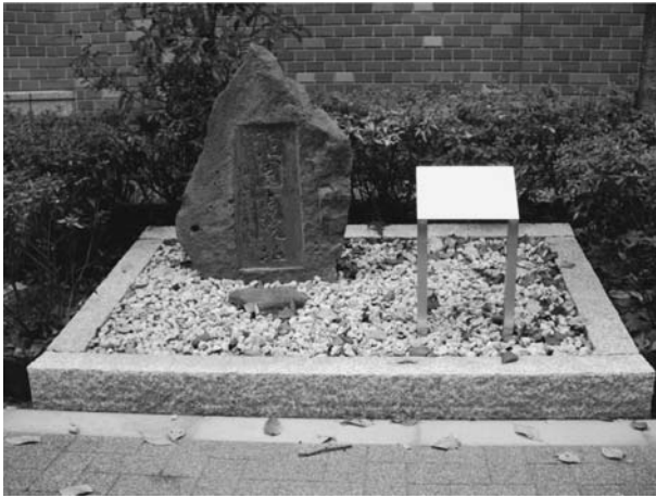
写真3 藤澤桓夫「泊園書院址」碑（本学以文館北側）

家の中庭に置かれていたため、その存在は外部に知られていなかったが、このたび幸運にもそれがわかったのである。偶然とはいえ、泊園記念会創立五十周年記念国際シンポジウム（後述）の準備中に見出されたのも不思議なめぐり合わせであった。