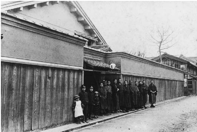
写真1 泊園書院本院（東区東平野町、現天王寺区東平二丁目）

（先考、弱冠にして身教育に任じ、卒するに至るまで五十年。帷下の士は三千余人、其の事業に遭遇せざるは一定ならざるなり。）