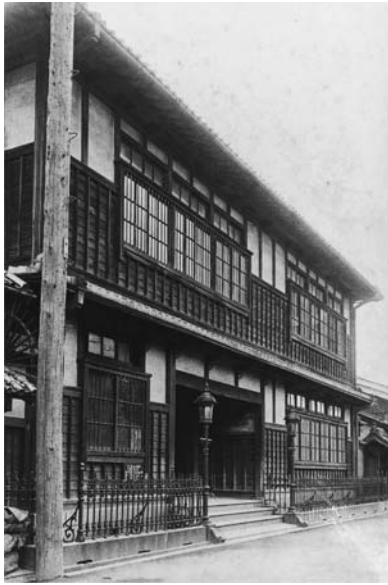
写真2 泊園書院分院、のち本院（南区竹屋町、現中央区島之内一丁目）

といっている。東咳は大坂居住時代だけでも足かけ四十年になり、平野含翠堂や豊岡藩・尼崎藩などでも講義を行なっているの、それらの聴講者を含めれば、東咳の聲咳に接した門人がこれぐらいでも不思議ではない。おそらくこれは当時の懷徳堂や適塾の塾生数をしのぐもので、泊園書院は幕末期における大坂最大の塾であった。当時の状況に関し、中井木菟麻呂『懷徳堂水哉館先哲遺事』は懷徳堂と対比して次のように述べている。 ①