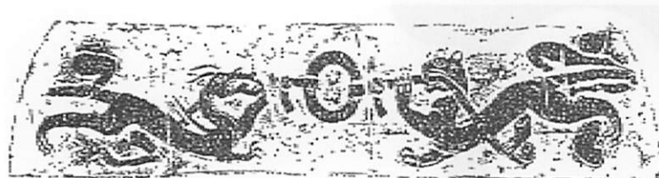
図9 四川省合川市 石墓（後漢）墓室の門柱 15)

翼を添付し、或いは、虎とセットにして、西王母の背後に置く。(図9、図10参照) 逆に言うと、現在わ