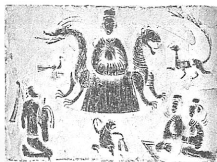
図10 四川省 彭州市、新都県などの地（後漢）画像石 16)