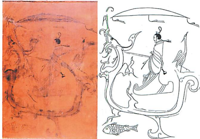
図6 湖南省長沙市 子弹库楚墓（戦国）帛画 10)