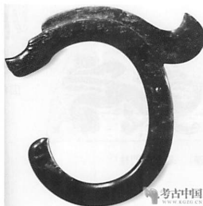
図7 遼寧省 紅山文化遺跡（約前4000年）玉龍 13)

龍、春分而登天、秋分而潛淵。物之至靈者也。淮南子言、萬物羽毛鱗介皆祖於龍。（中略）王符稱、世俗畫龍之狀馬首蛇尾、又有三停九似之說、謂自首至膊、膊至腰、腰至尾皆相停也。九似者、角似鹿、頭似駝、眼似鬼、項似蛇、腹似蟹、鱗似魚、爪似鷹、掌似虎、耳似牛。頭上有物如博山、名尺木、龍無尺木不能升天。（中略）古者有豢龍御龍氏徒、以知其欲惡而節制之耳。將雨則吟、其聲如憂銅盤、涎能發衆香、其噓氣成雲、反因雲以蔽其身、故不可見。今江湖間時有見其一爪與尾者、唯頭不可得見。自夏四月之後龍乃分方、各有區域、故兩畝之間而兩鳴異焉。又多暴雨說者、云細潤者、天雨猛暴者龍雨也。龍火與人火相反、得濕而焰、遇水而燔、以火逐之則燔熄而焰滅。（中略）故在人比君、在卦比乾之七爻、象天蒼龍七宿、乾七爻以龍為用天、七宿以龍為體、盖自下數之其第一爻潛