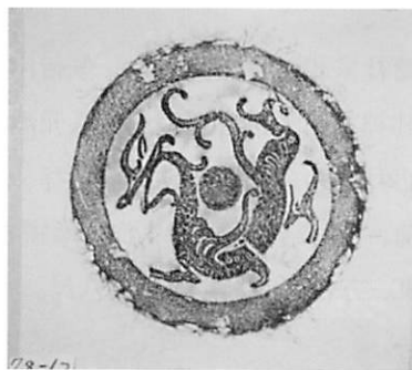
図1 漢青龍瓦當拓本 5)

古代中国の天文学によると、華北平原の上の空には二十八宿（図4参照）があり、そのうちの東方七