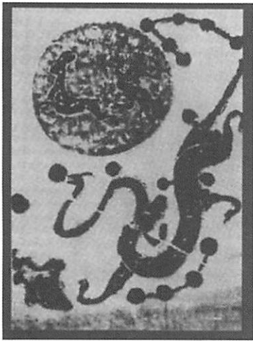
図3 河南省南陽 漢代画像石 7)