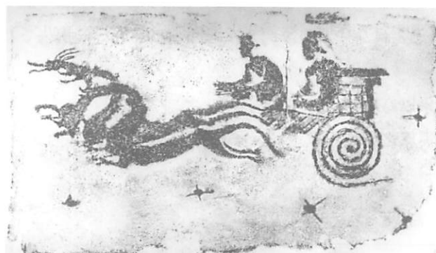
図5 四川省彭州市 漢墓 壁画 9)