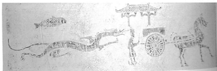
図8 四川省樂山市 鞍山崖墓（後漢）石棺外壁 14)

総じて、古典哲学の著作に引用された龍と、今まで発見された画像石に現われた龍をあわせてみると、漢代の龍は、水族の長、雨乞いの媒介、自在に体を変化させる靈獣、四神の一つ（東方の代表）、墓、建物（主に王宮に使われる）の守護神、神々の乗り物、死後昇天の引導者などのイメージの複合体である。画像石に刻まれた龍の姿の検討を踏まえて、便宜上、大きく分けて「水龍」と「天龍」で名づけよう。そして、水龍から天龍へ、昇天という動作によって形の変化することが可能であり、また、記録はないが、逆方向の変化も可能だと考えられる。その龍の二つの姿を表現するとき、水龍であれば、そのそばには、目印として、必ず魚が描かれている。(図8参照) それに対して、天龍を描く場合には、龍の肩に