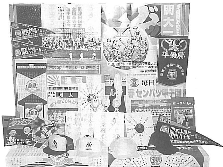
両大会を通じて集まった応援グッズの数々

増加する一方であるし、その対応にも今まで以上のスピードが要求される。しかし、だからといって資料の収集・調査を止めることはできない。それをすれば年史業務を放棄することになるからだ。