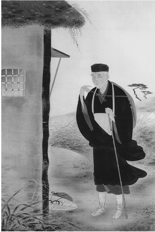
图6 太田聽雨《霜之宿》