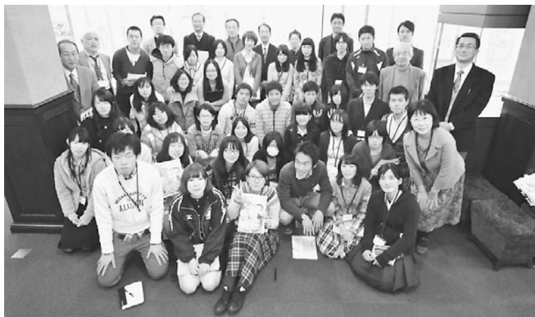
平成26年度博物館実習展風景