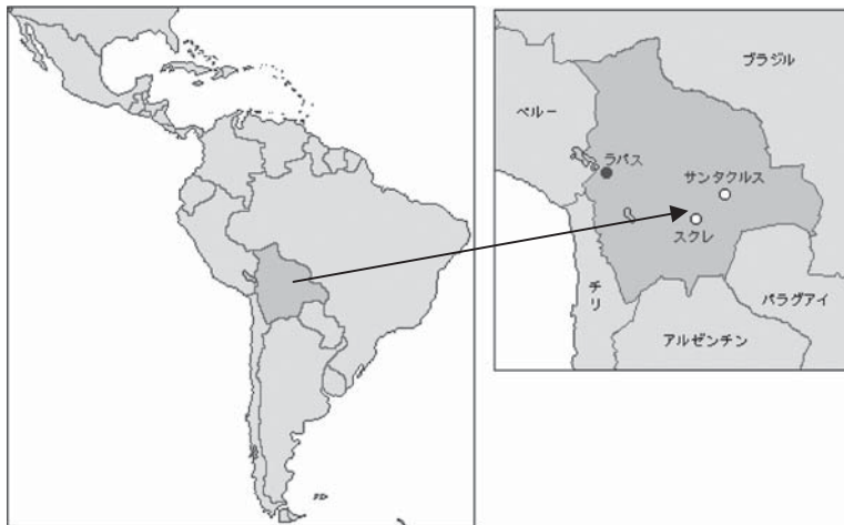
図1 チュキサカ県スクレ市