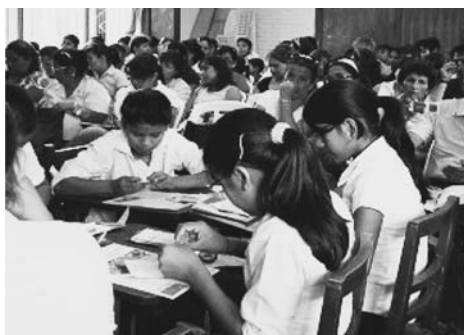
写真3 後方で授業を参観する教師