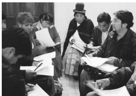
写真1 教材研究をする教師たち