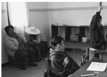
写真2 公開授業に参加する保護者

ろん協力してくれる。」と現状を語る(写真2)。E教師も同様に、「保護者に対して授業を公開するのは私の教え方を理解してくれる意味でいいことだと思います。10月の公開授業も予想以上に保護者が参加してくれて私は自信ができました。」と保護者の理解が教育実践への自信につながっていると語った。