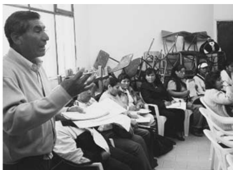
写真4 授業後の反省会での意見交流

もっている熟練の教師になるほど公開授業へ抵抗を感じる事が多く、教師同士で信頼関係を深めながらよりよい同僚関係を構築していくことが必要である。