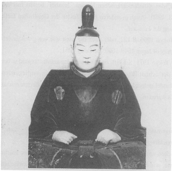
Abb. 1: Kyushu, 17. Jahrhundert; Darstellung des Arima Harunobu. Holzfigur im Tempel Daiunji, Maruoka, Praefektur Fukui.