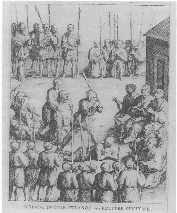
Abb. 5: Christenverfolgung in Arima. Aus Trigautius, 1623.