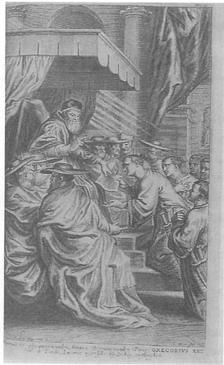
Ihre paenstliche Audienz