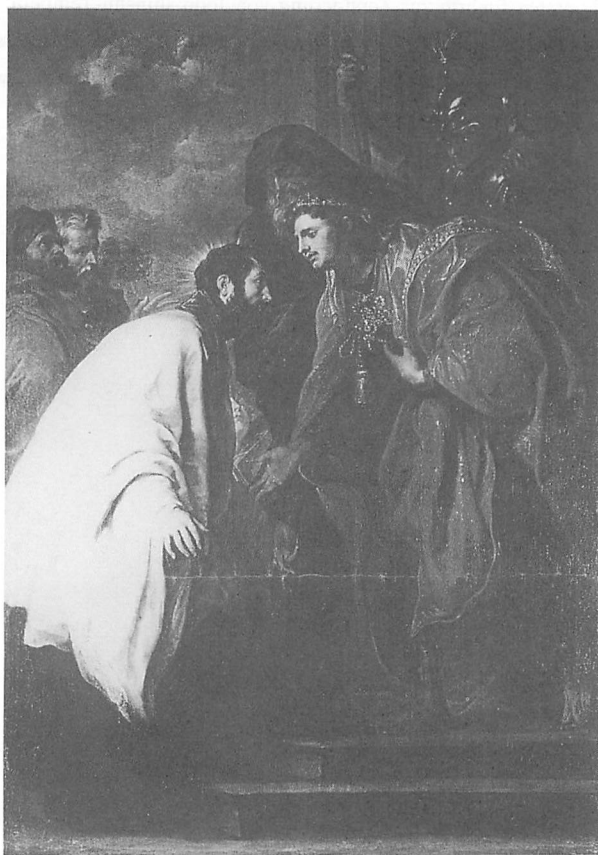
Abb. 2: Audienz des Franz Xaver bei Otomo Sorin, Fuersten von Bungo; v. Dyck zugeschrieben.