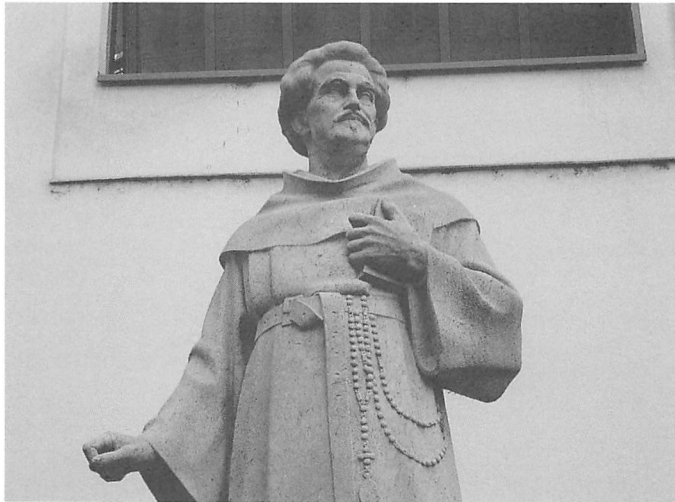
Steinfigur des Abraham a Sancta Clara (1644-1709; Wien, nahe Albertina;); er uebernahm eine konfuzianische Erbauungsgeschichte (von der Pietat dreier Brueder gegen ihre Mutter) in seine christliche Erbauungserzählung (siehe: Materialanhang dieser Arbeit)