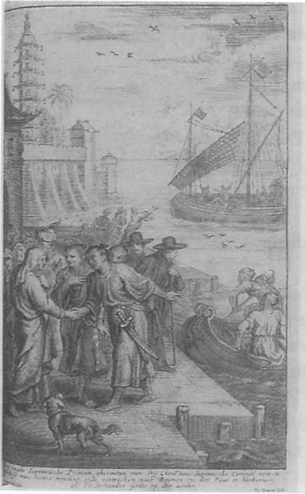
Abb. 3: Abschied der japanischen Prinzen im Hafen Kuchinotsu, Shimabara. Aus: Hazart, 1667, Vol 1, S.62, 68.