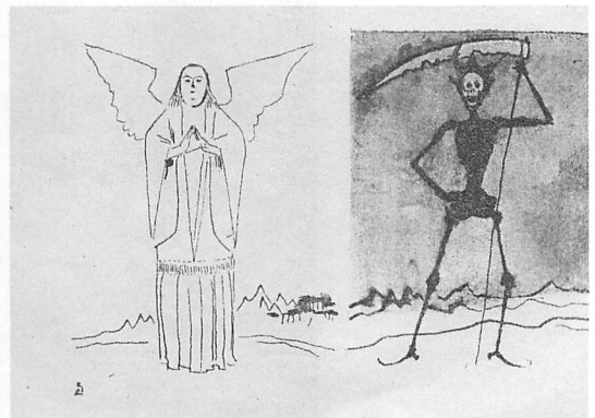
Abb. 7: Illustration aus Sato Haruos Arima-Roman (siehe: Abb. 6), unbetitelt; im Kontext bittet Harunobu den japanischen Romentsandten, nach dem eigentlichen Anliegen der christlichen Japanmission zu fahnden.