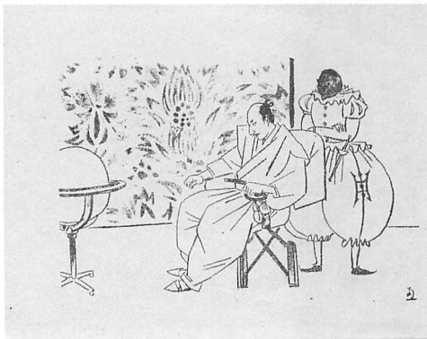
Abb. 6: Illustration von Fukuda Sen'ichi in Sato Haruos Roman "Arima Harunobu" (1943), unbetitelt; Harunobu hier wohl als nationaler Vorkämpfer fuer den suedlichen Vorstoss Japans im Pazifikkrieg.