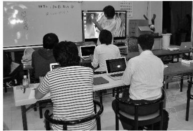
写真1 A町役場での技能訓練の風景

この技能訓練は、C型企業の大阪での企業研修の提供なども得、また、A型支援企業での大阪での訓練生の居住地の提供などがあり、最終的に2名が新規企業の従業員となった。技能訓練では、行政の支援と在阪のIT教育企業の協力が極めて重要であり、地域内の行政を含むA型参画と地域外のC型参画が必須であった。また、地域内外で訓練に参加しようとする意欲を持つものが、プロジェクトにアクセスするためには個別のネットワークをたどった紹介が極めて重要であり、自立的復興支援においては、1) 地域内のA型参画、2) 地域外のB型参画、3) 地域内の弱い紐帯による斡旋、の3者であった。これらが一般的に重要になるかどうか、またその理由は何かについては、あらためて稿を変えて議論するが、域内組織、域外組織、域内個人ネットワークの3者が重要であったという点は、理論的にも示唆的なものである。