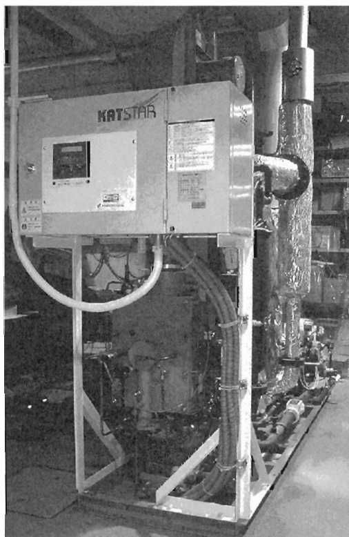
図2 JS-500G-Z管巢燃焼ボイラ（蒸発量0.5t/h）