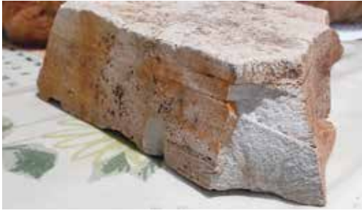
写真7 板状白化流紋岩

まる。奈良県田原本町唐古遺跡など奈良盆地の弥生時代遺跡でも、白化した短冊状の畝傍流紋岩が石包丁や磨製石斧の石材となっている事例が知られ、弥生時代の磨製石器原石産地として認知されているが、打製石器はない。現在畝傍山で容易に採取される白化板状石材は、流紋岩の流理構造から平坦板状に剥離する性質があって(写真7)、加撃剥離の痕跡を観察しにくいのが、石包丁や磨製石斧制作のため弥生時代の人為的な石材切出しや整形の所作が介している可能性がある。