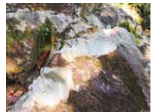
写真2 東尾根鞍部流紋岩露頭 (A)