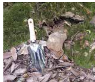
写真3・4 山頂北側斜面の打製石器と流紋岩片 (B)