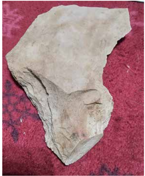
写真5 採集した打製石器

畝傍山の西側に南北180mの急斜面で山頂にまで達する馬蹄形の抉れ部分があって（図1C）、山体崩壊の痕跡とされる。成迫法之は、この素因が流紋岩の高角節理と熱水変質の進行にあるとし、地震が誘因となったと考察している。この崩壊は、西方向に崩壊による流紋岩礫を含む