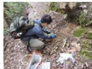
写真1 畝傍山の石材採集