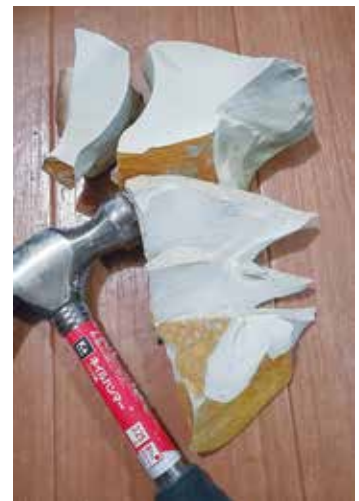
写真6 硬質流紋岩の試割り

畝傍流紋岩の旧石器時代石器は、奈良県下で知られていない。隣接する橿原縄文時代遺跡（末永1961）にも、畝傍流紋岩製打製石器の出土はなく敲石や砥石がわずかにあるに留