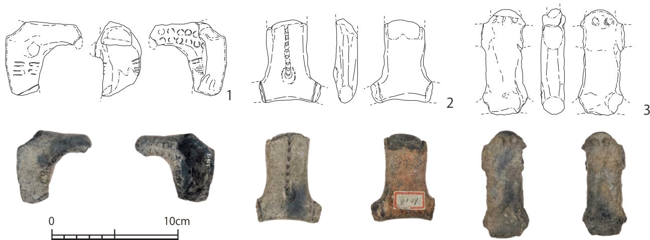
第1図 本山コレクションの土偶実測図 (S=1/3)・写真 (縮尺任意)

先にみたように、蓑虫山人は青森県内を行脚する中で蒐集した考古遺物を自ら描き記録している。その中には、形態等の類似度から当館所蔵の本山コレクション中にみられる資料と同一個体である可能性が高い資料が示されている。