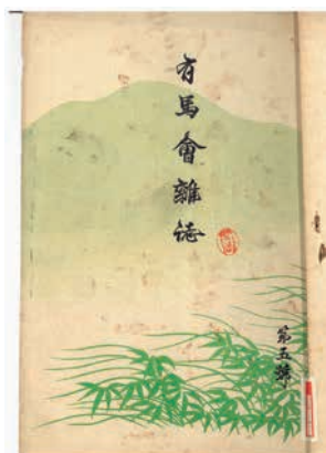
第1図 九鬼隆一 第2図 有馬會雜誌第5号 1900年