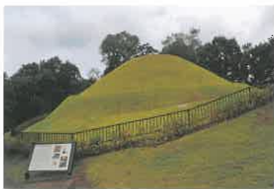
写真1 復元された高松塚古墳の墳丘

その後、発掘調査の成果に基づき、墳丘は築造当時の姿（二段築成の円墳、下段部直径23m、上段部直径18m）に復元された（写真1）。復元された墳丘の表面には、風雨による墳丘の崩落を防止する目的で芝草が貼られており、当然のことながら樹木はなく、今日における一般的な古墳の墳丘の外観とは大きく異なっている。