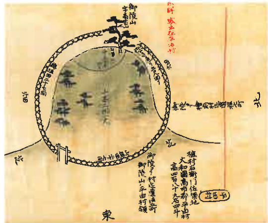
写真3 元禄期の高松塚古墳(2) (『大和国御陵図』)

のもの(写真2)と丸垣を加えて描いたもの(写真3)とあるが、墳頂部の松は斜面の松とは樹齢が異なる表現で描かれており、この墳頂部の大木が古墳名の由来ともなったのであろう。