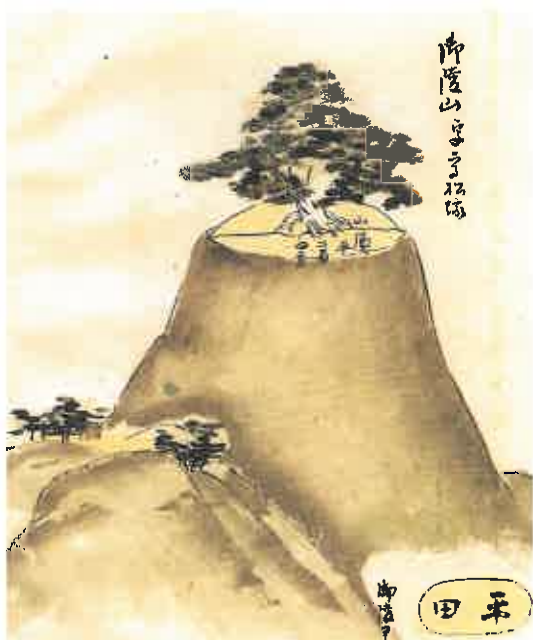
写真2 元禄期の高松塚古墳(1) (『大和国陵廟之図』)

同じく1697年に大和国内の不分明陵を踏査した奈良(南都)奉行所与力玉井与左衛門・坂川武右衛門が作成した「文武天皇御陵歟」によると、高松塚古墳には松15本が茂り、墳丘の木を伐採すると、ことのほか祟りがあることや、一里塚のような姿に見えたことが記されている。元禄期の高松塚古墳を描いた転写本には、墳丘だけ