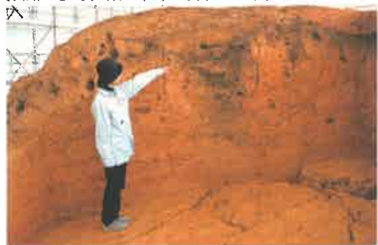
写真4 墳丘断面に現れた大木の根の痕跡