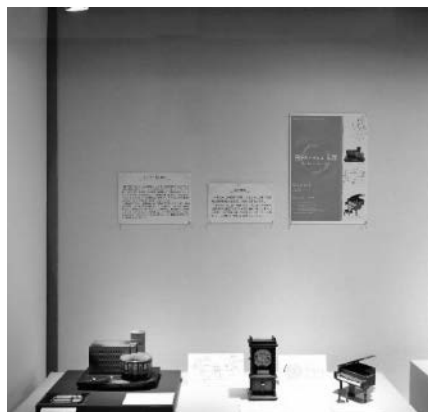
音のないオルゴール展