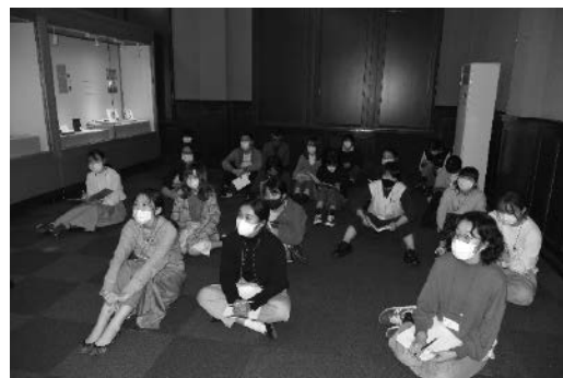
博物館実習展講評