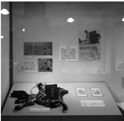
生命を得た看板展