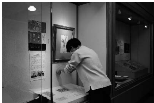
博物館実習展風景