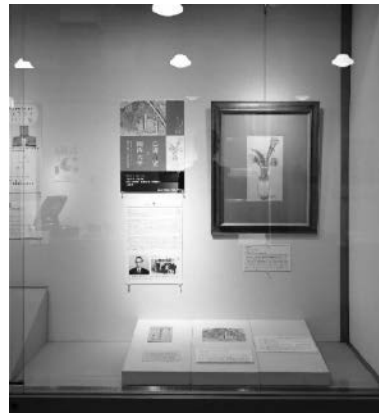
鳥海青児と関西大学