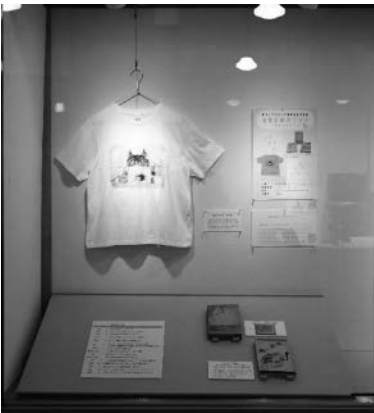
日常中のフジタ～時代を超えて～