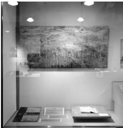
読・観～漢字を観てみよう