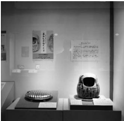
暮らしのぬくもり