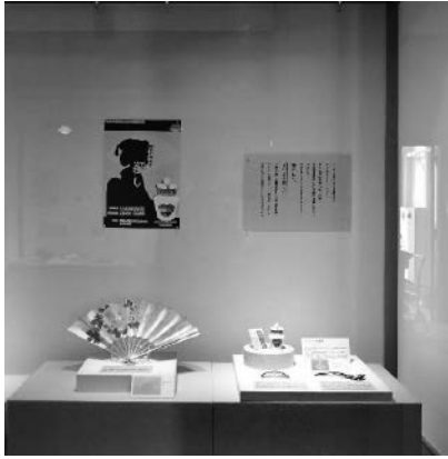
戦前の女性の装い