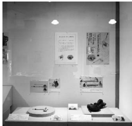
筆記用具の中の動物展