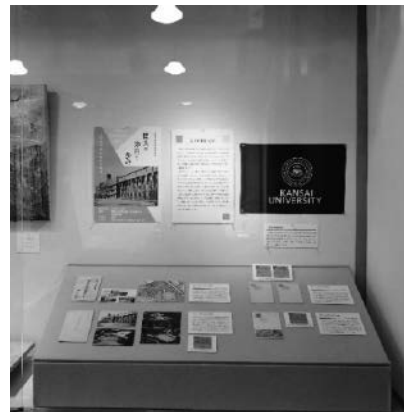
関西大学の節目と歩み～記念葉書からみる歴史～