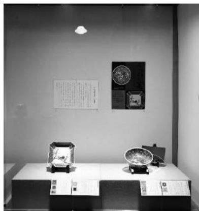
うつわの美—江戸時代に成立した陶磁器—