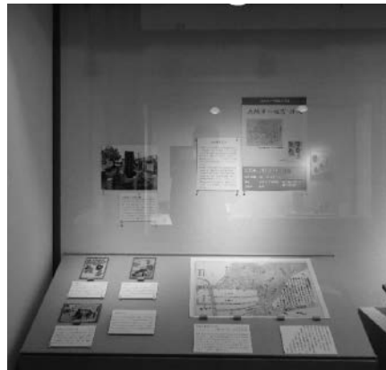
大阪市の地震・津波