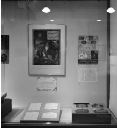
祈り～信仰は海を越えて～