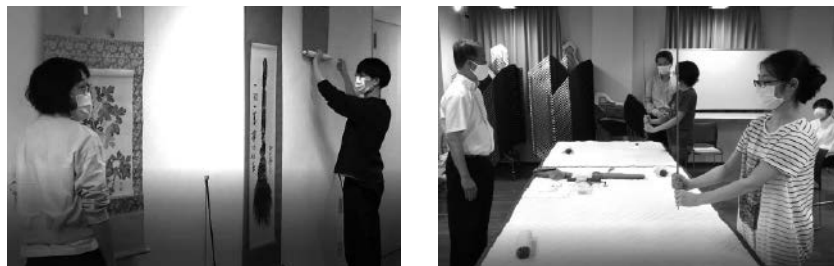
2020年度博物館実習風景 前期の対面授業