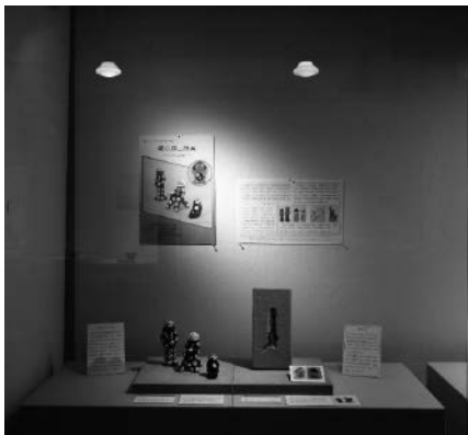
日本の猿の郷土玩具—こめられた願い—