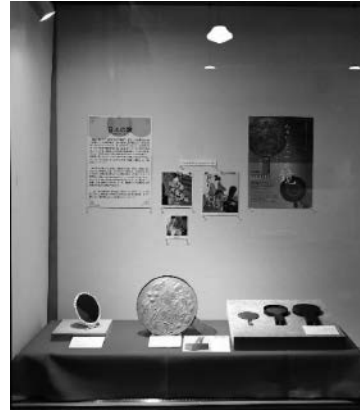
人々にとっての鏡～江戸時代と現代～