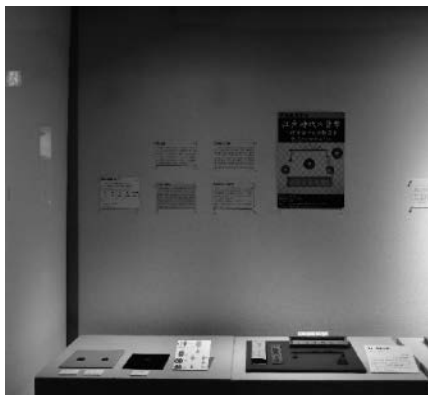
江戸時代の貨幣制度について