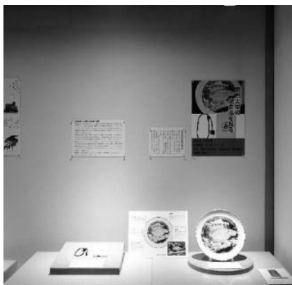
関西大学の記念品を見る