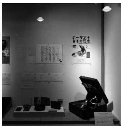
ポータブル音楽の歴史