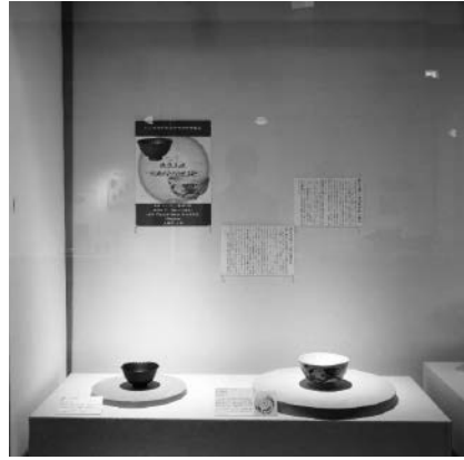
波佐見焼—大衆のための焼き物