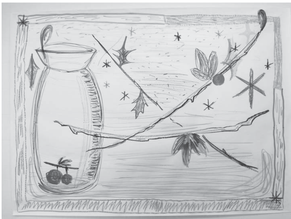
図3 対象者Eと対象者FのConv-D（2回目）