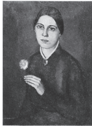
図2、《無題（花を持つヘルマ・シュヴィッタースの肖像）》 1917年、厚紙に油彩、66 ×49cm、Nachlass Kurt Schwitters