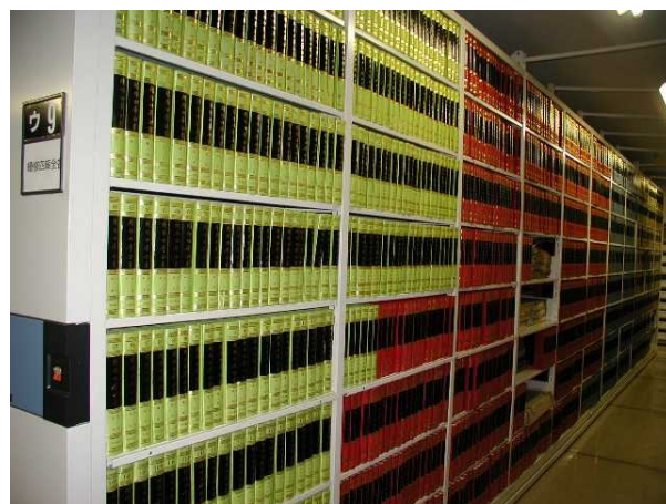
架蔵された『続修四庫全書』

調査の対象は国家図書館(北京図書館)、上海図書館、南京図書館、天津図書館、浙江図書館など82機関にわたり、全国の図書館の関連蔵書が網羅的に集められた。こうして約8年にわたる収集、整理、影印作業を経て、全5212種、洋装1800冊(経部260冊、史部670冊、子部370冊、集部500冊)、目録1冊からなる『続修四庫全書』が出版されたのである。収載書籍5212種というのは四庫全書の約1.5倍に相当する分量であって、その規模の大きさが知られるというものである。また四庫全書にならって、経部は緑色、史部は紅色、子部は藍色、集部は灰色とい